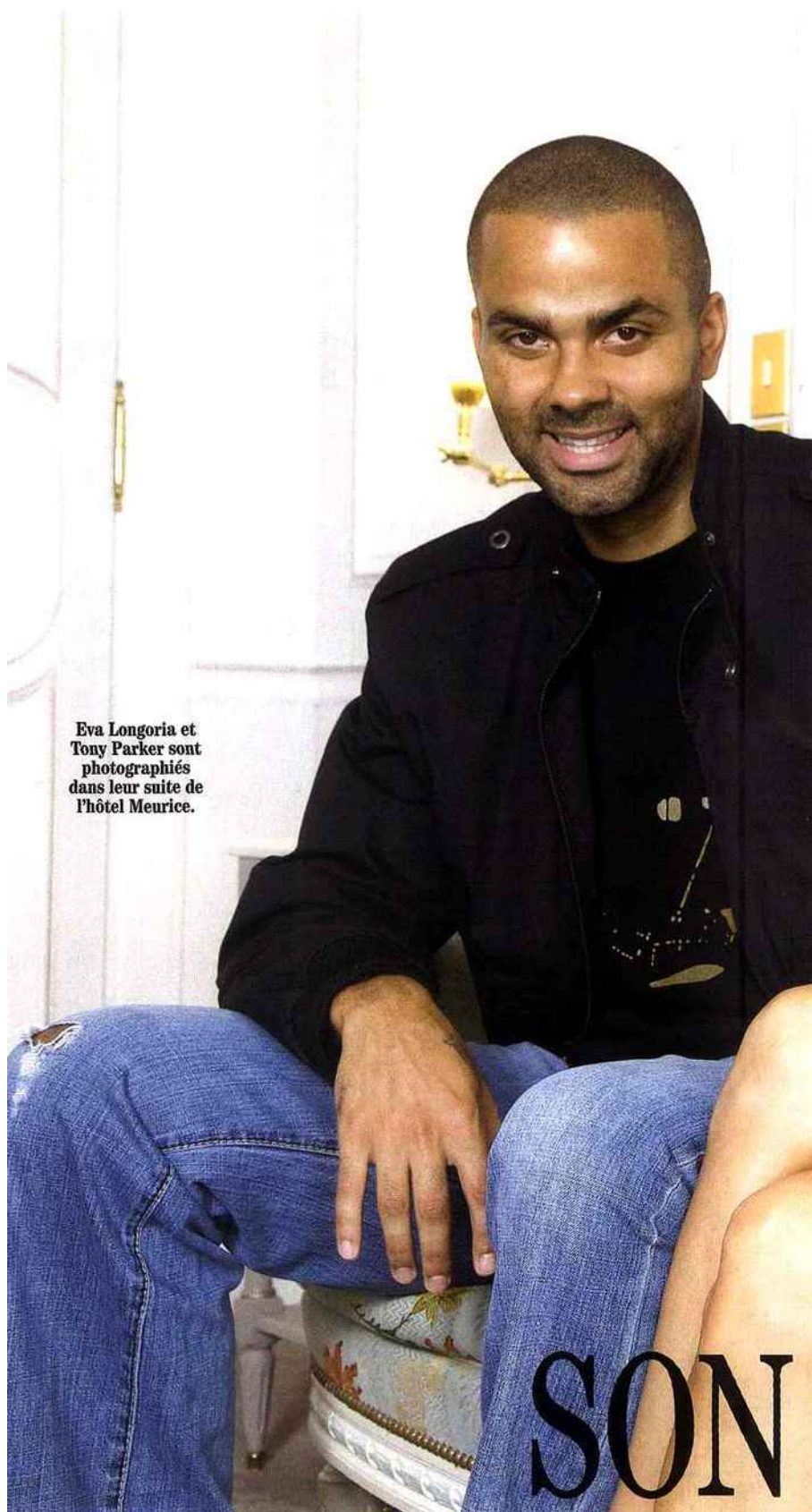
Eva Longoria et Tony Parker sont photographiés dans leur suite de l'hôtel Meurice.

Non! Je le suis devenue par accident. Après mon diplôme universitaire, j'ai remporté un concours de beauté qui m'a envoyée à Los Angeles. J'avais 22 ans.